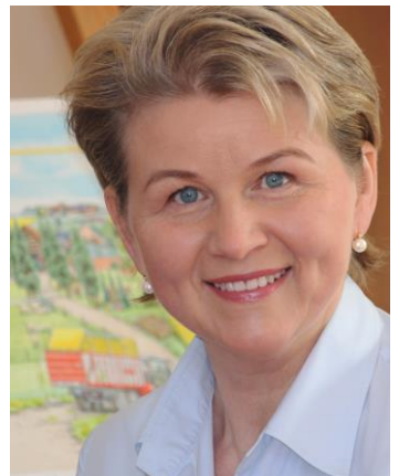
Marion Kreimeyer-Visse © privat

Während des Recherchetermins zu „Was passiert im Krankenhaus?“ in der Universitätsklinik für Kinder- und Jugendmedizin Tübingen habe ich von einem schwerkranken Jungen im Rollstuhl und seinen Eltern große Unterstützung erhalten. Sie haben mir Fotos von ihm zur Verfügung gestellt. Zum Dank hatte ich den Vater und seinen hilfsbereiten Sohn im