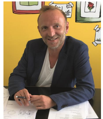
Peter Nieländer © Ravensburger

Heiß geliebte Bücher meiner Kindheit und sicherlich echte Klassiker sind die „Wimmelbücher“ von Ali Mitgutsch! Großartige Entdeckungsreisen, voller Witz und Spannung!