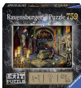
Im Vampirschloss (ET Jan. '19)