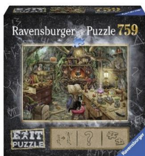
Die Hexenküche (ET Sept. '18)