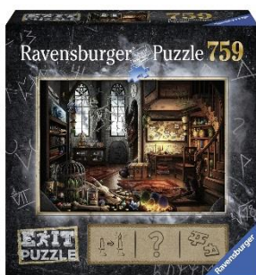
Im Drachenlabor (ET Jan. '19)