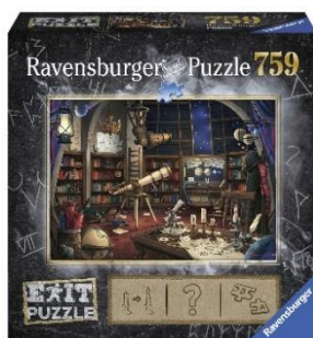
Die Sternwarte (ET Sept. '18)