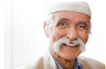
Ali Mitgutsch

Für sein erstes Bilderbuch bei Ravensburger, „Rundherum in meiner Stadt“, (1968) wurde er mit dem Deutschen Jugendliteraturpreis ausgezeichnet. Es wurde bisher mehr als 1,3 Millionen Mal verkauft. Insgesamt gingen seine Bücher allein in Deutschland über fünf Millionen Mal über den Ladentisch, international kamen mehr als drei Millionen